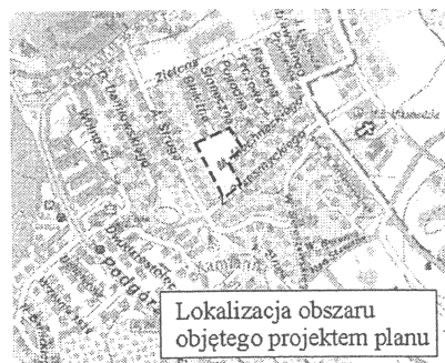
Lokalizacja obszaru objętego projektem planu